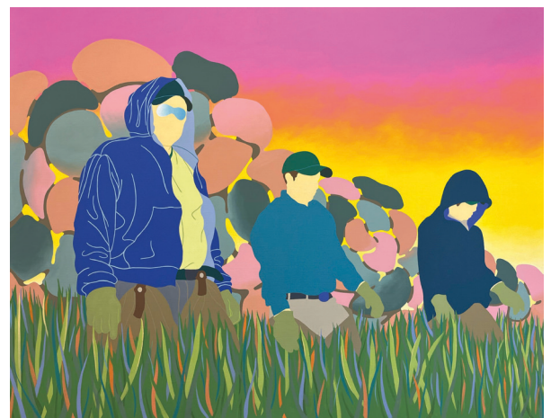
Thibault Laget-Ro - La vague - 114 x 146 cm ADAGP Paris © 2023

Cette œuvre originale sera acquise par la ville de Pont-l'Évêque pour une mise à disposition au sein de l'Artothèque.