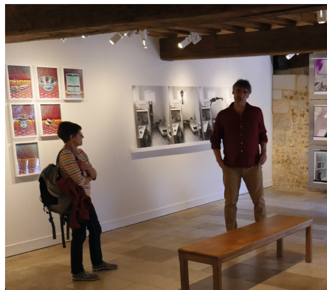
Exposition de M. Riffret Nos prisons

En 2000, Pont-l'Évêque célébrait la restauration de son quartier ancien et inaugurait la nouvelle fonction de l'ancien couvent des Dominicaines : un Espace Culturel à vocation muséale.