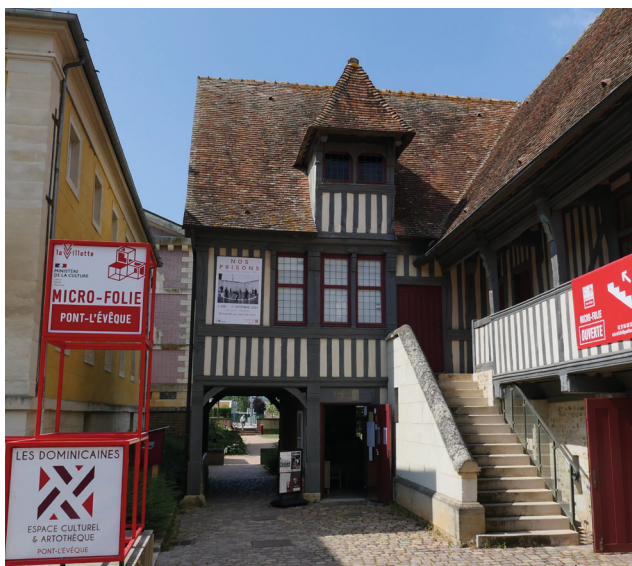
Ville de Pont-l'Évêque©