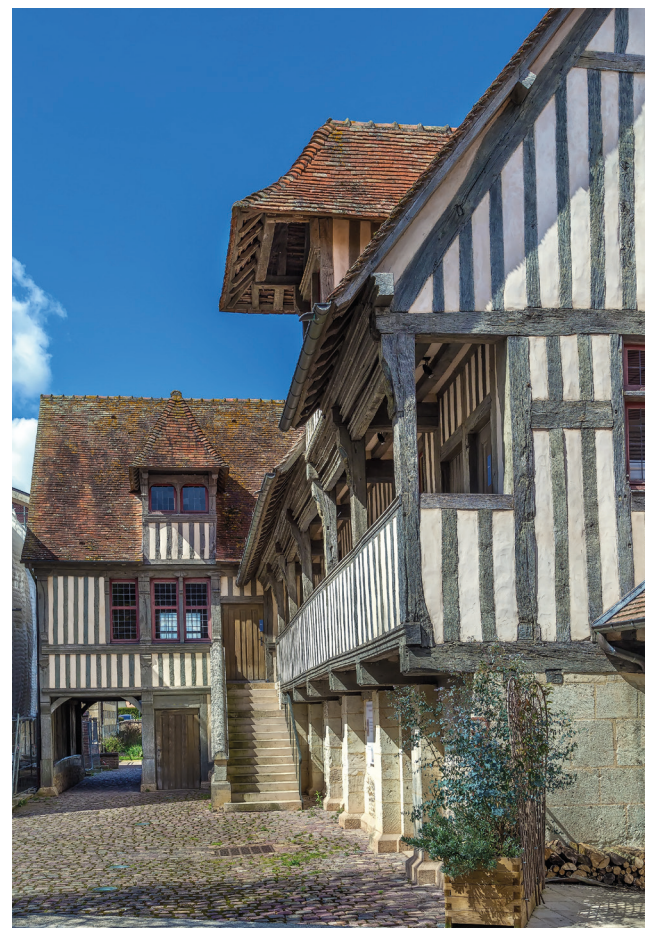
Ville de Pont-l'Évêque

l'art. Au-delà de la valorisation du patrimoine pontépiscopien et du soutien à la création contemporaine, les Dominicaines ont également pour objectifs de rendre l'art accessible à tous, de contribuer et favoriser l'éducation culturelle et enfin de créer du lien entre tous les acteurs culturels du territoire.