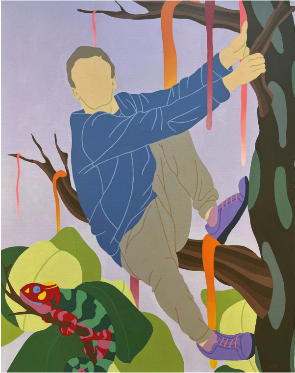
Thibault Laget-Ro - Cache-cache - 81x 65cm ADAGP Paris © 2023