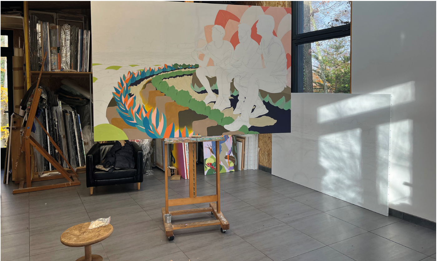
Thibault Laget-Ro © - Atelier - 2023

Thibault Laget-Ro est un artiste français né en 1976. Il est diplômé d'un DESS en Sciences du Management et d'un master 2 en Arts Plastiques de l'Université Panthéon-Sorbonne.