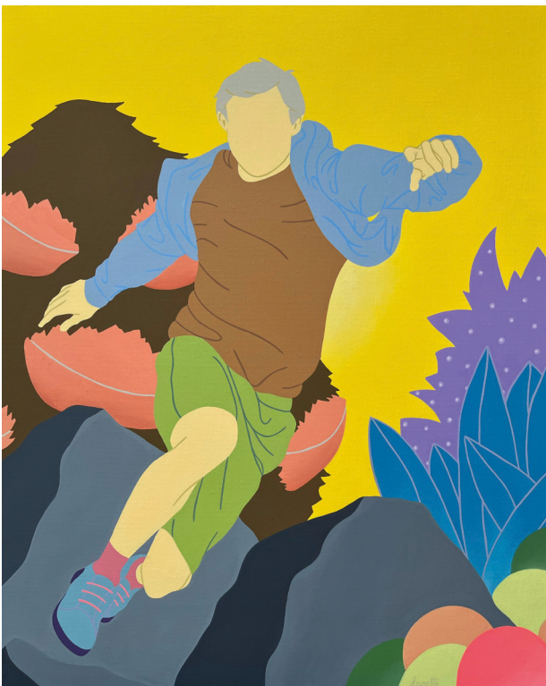
Thibault Laget-Ro - L'attrape rêves - 81x 65 cm ADAGP Paris © 2023