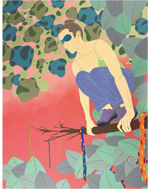
Thibault Laget-Ro - L'équilibre sur une branche 146 x 114cm - ADAGP Paris © 2023